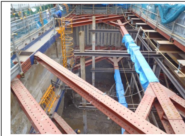
<建築物件> 戸田建設(株) 都内某現場

本商品は、高強度腹起材のため、切梁や中間杭を無くす、又は、削減することができ、山留支保工全体で軽量化を実現します。広い空間で掘削効率が上がり、構築物の品質向上や工期短縮に寄与いたします。